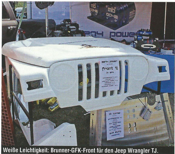
Weiße Leichtigkeit: Brunner-GFK-Front für den Jeep Wrangler TJ.